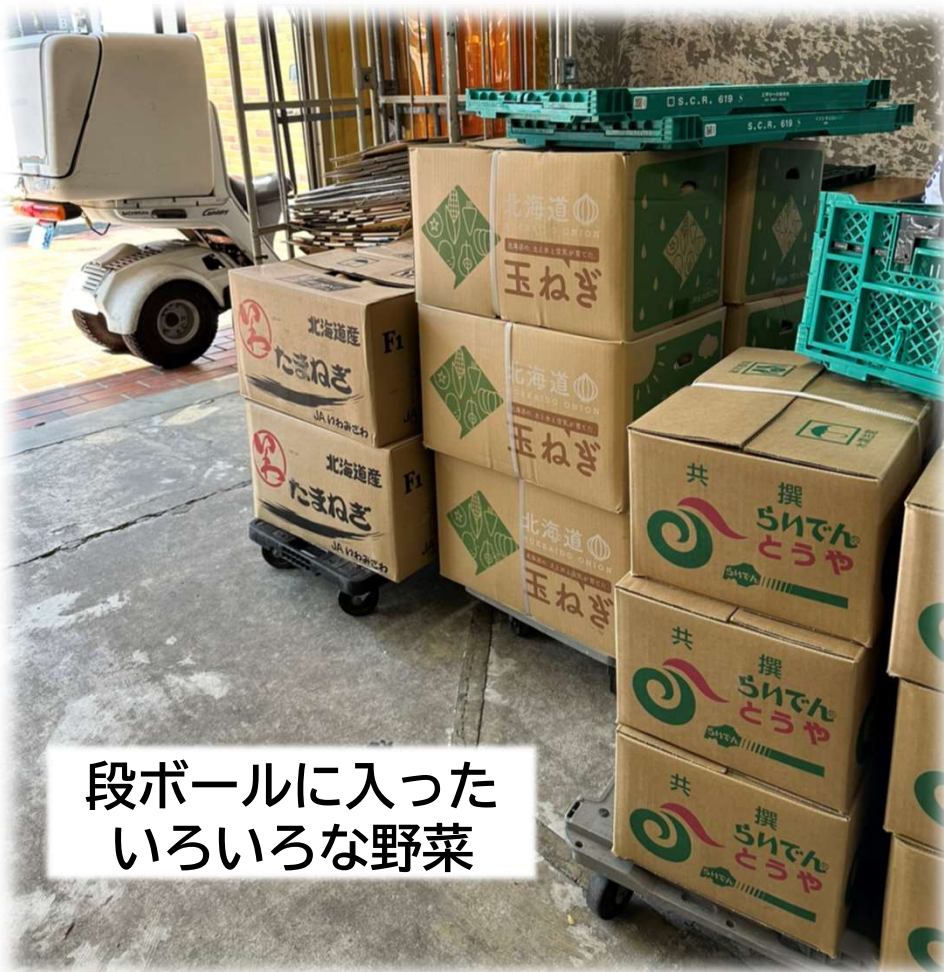
段ボールに入った いろいろな野菜