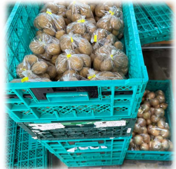
袋詰めされた野菜